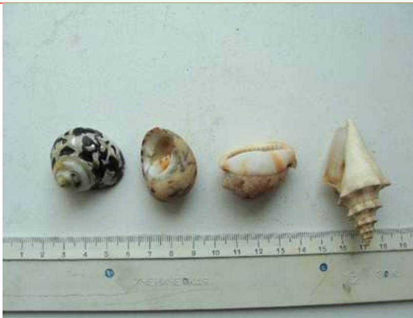
Рис. 5. Крайняя справа – маленькая «Катушка» (из более позднего улова). Крайняя слева – перламутровка. Остальные не имеют имён «от советиков»

Несколько слов о названиях ракушек. Все приводимые здесь «имена» взяты из лексикона советских специалистов (а ракушки на фото – только из собственных трофеев). Кем и когда они были придуманы – кто теперь выяснит? Поскольку наименования дали только крупным ракушкам (а разной мелочи мы привезли более сотни), то многие так и остались безымянными. Я хорошо ориентировался в названиях, поскольку общался со «стариками», единственное, с чем так и не согласился – с названием «катушка»: я до сих пор считаю, что это просто молодая «развёртка».