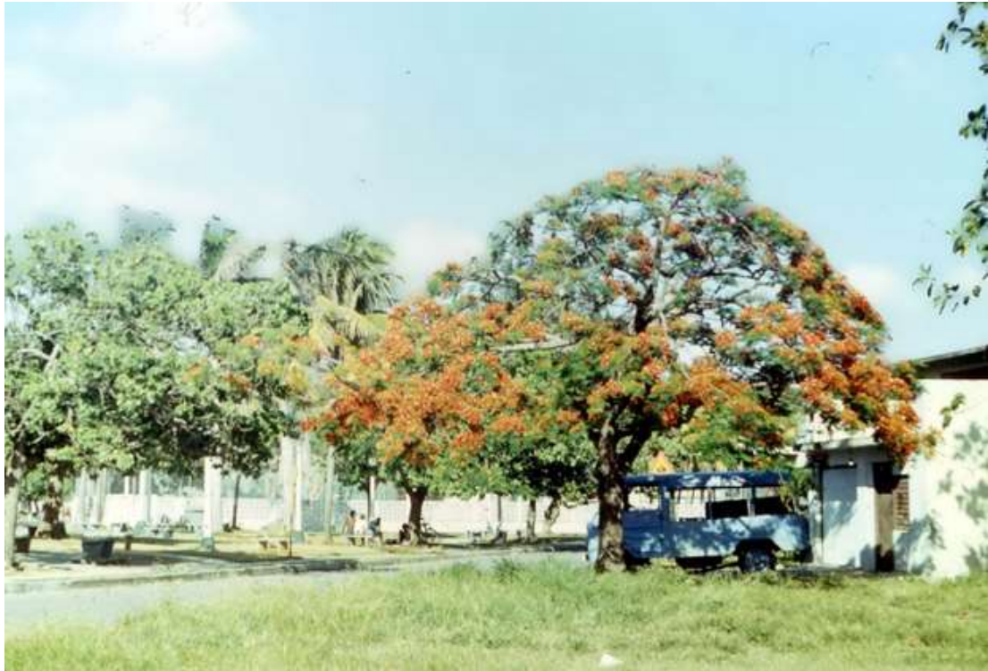
Рис. 1. Цветёт «акация» (дальняя родственница)

слов, часа за полтора вспомнил всё, чему учился и получил зачёт. После понемножку пополнял словарный запас, а на третьем году пребывания даже ездил в командировку на восток острова без переводчика.