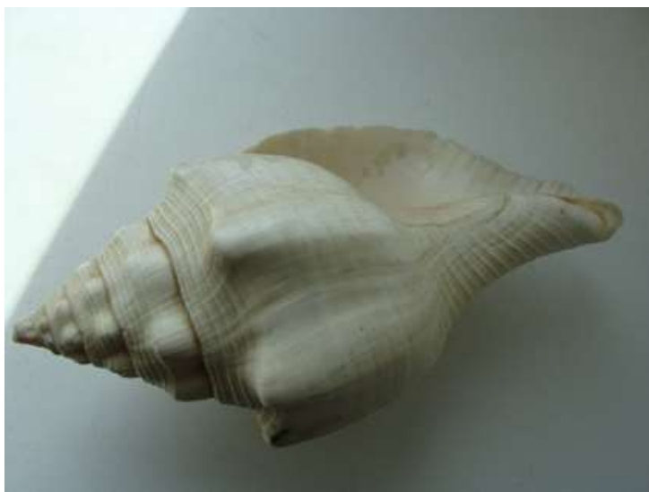
Рис. 4. «Парусник» (из более позднего улова. Этот экземпляр побывал в желудке осьминога, потому такой чистый снаружи).