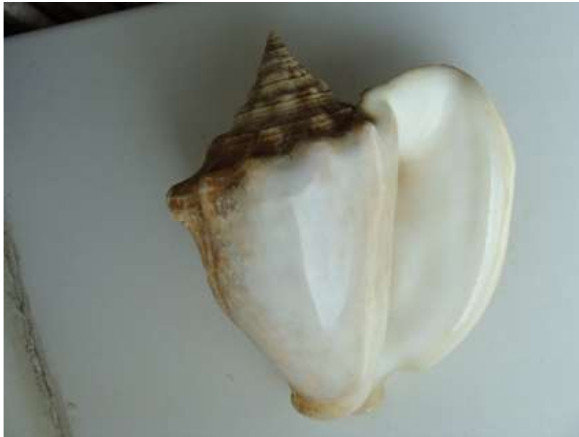
Рис. 6. «Свиное ушко»

необычную для нас ночную грозу. Где-то высоко появляется яркая вспышка, потом на поверхности облака появляется огненный зайчик, который перескакивает с облака на облако, виляя со стороны в сторону. От удара молнии в облако как бы высекается другая молния, затем – следующая. Потом вдруг она разветвляется, и, расходясь, скачут два зайчика, они почти одновременно вдруг взрываются и в разные стороны разлетается 5–7 стрел – как фейерверк, охватывая полнеба и озаряя город. Жарко бывает только в середине дня, но тут же налетает грозовой дождь, становится прохладно.