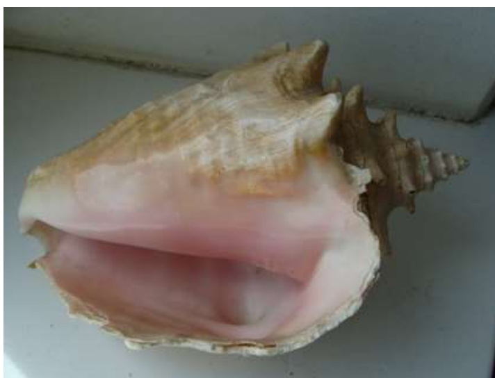
Рис. 14. Самая красивая «развёртка», которую я поймал на Варадеро, а обломал при впихивании коробки в нишу вагона в Москве. Заметно уже выцвела