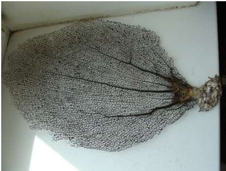
Рис. 11. Такой же коралл, но отваренный и со смытой под напорной струёй воды мякотью

Алексей начал готовиться к отъезду в Союз. 21 мая писал сочинение, 24 – устную литературу. В свободное время ходим с ним по городу и фотографируемся. В это время солнце в обед стоит почти прямо над головой, тени от человека почти нет, пытаюсь запечатлеть это на фото.