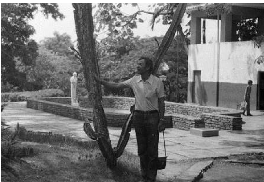
Рис. 3. Опунция разных видов и размеров. Жёны наших специалистов обламывают их «для анализа»

10 февраля всей группой ездили в Сороа – туристический центр в 70 км западнее Гаваны, уже в провинции Пинар-дель-Рио. Он славится своим ботаническим садом, а также оранжереями орхидей – второй в мире после Сингапура. Здесь собрано 700 видов орхидей. В саду имеются деревья со всех тропических зон других материков, но для меня тогда вся флора Кубы была диковинкой.