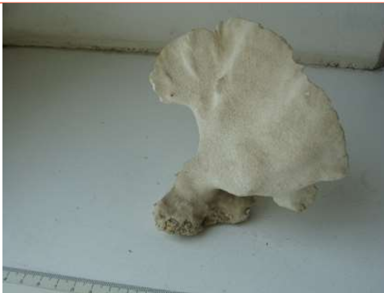
Рис. 8. Коралл «лосиные рога»