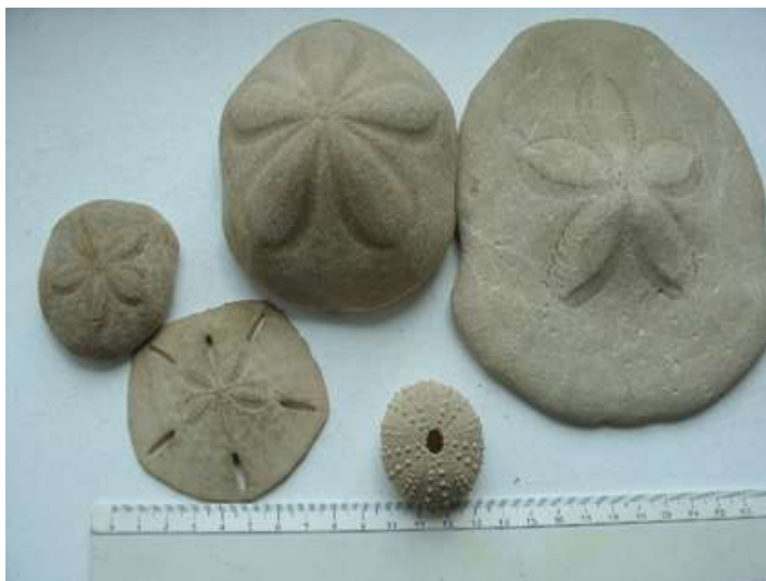
Рис. 17. Скелеты разных морских ежей

С гуаявой связана ещё одна кубинская «заморочка». Забегая вперёд, расскажу, как во время командировки в следующем году в Сантьяго-де-Куба меня возил на работу шофёр-кубинец лет пятидесяти, который, кажется, не проехал мимо ни одной приметной девушки или женщины, чтобы не крикнуть какое-нибудь слово: бонита, дульсия (красивая, сладкая) и т.п. Я стал прислушиваться. Одной ладно скроенной мулатке лет 12–14 он крикнул «Гуаява!» Девушка повернулась к нему и осуждающе произнесла: Чико! Я спросил, почему гуаява? Последовал ответ на испанском в сопровождении жестов. Перевожу: что такое гуаява – знаешь? – Да, знаю. – Твёрдый вкусный фрукт! Через некоторое время он крикнул рослой негритянке с довольно пышными формами: Лангоста! (лангуст по-испански). Я и тут переспросил.