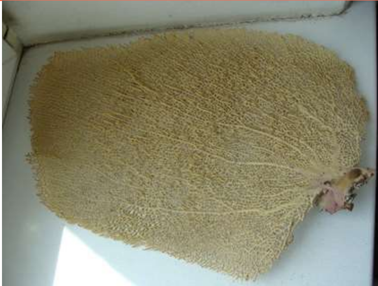
Рис. 10. Коралл-«листок», просто высушенный