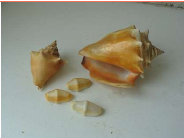
Рис. 13. Две «варадерки» и три «пуговицы»