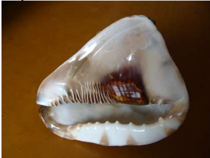
Рис. 16. Красавица «зубатка»

Гуаява – это твёрдый плод размером со среднее яблоко, с более жёсткой коркой, чем у апельсина. У созревшего плода внутри малиново-красная сладкая мякоть с сильным ароматом клубники, но она напичкана множеством очень твёрдых косточек диаметром до 3 мм, которые приходилось «сепарировать» через дуршлаг или сеточку.