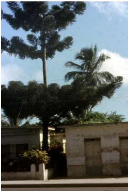
Рис. 2. Араукария «семь этажей»