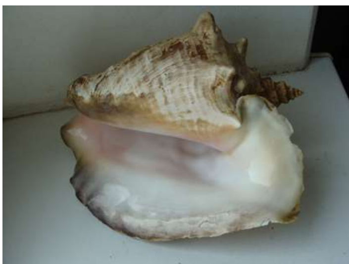
Рис. 15. Толстостенная «развёртка» из Плайя-Ларга