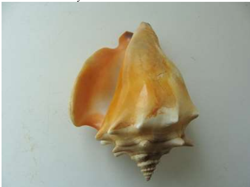
Рис. 7. «Варадерка»

С 17 по 26 апреля был в самой длинной командировке в Матансас (длиннее была в Сантьяго-де-Куба, но позже). Эта командировка запомнилась участием в Domingo rojo (красное воскресенье), по образцу наших субботников – выезжали в пос. Mocha (Мóча) примерно в 15 км юго-западнее Матансаса. Плантация томатов –