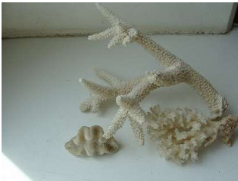
Рис. 9. Кораллы «оленьи рога» и другие

Плаваем над кораллами там, где их острые концы глубже от поверхности, по сторонам торчат острые «лосиные рога» размером до полутора метров, царапая руки и ноги. Хорошо, что нет волны: в шторм живым через эти «ножи» не перебраться. Срываем несколько кораллов-листьев: хватаешь обеими руками, отталкиваешься ногами от рифа, отрываешь коралл и взлетаешь на поверхность.